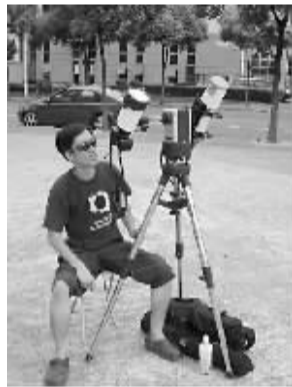
19日在家附近演练观测

2008年的那次观测，以为像郭纲这样的资深天文爱好者，拍摄自是不会留下什么遗憾。然而当1分多钟的美景发生之时，郭纲兼顾着照相机与摄像机，一心想拍下周围场景，手忙脚乱间居然按了两次拍摄键，最终没有拍到理想的视频。